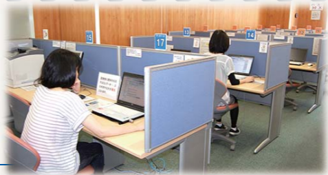
気軽にデータベースが利用できる市民開放端末